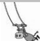
Affiche de l'annuelle 2008