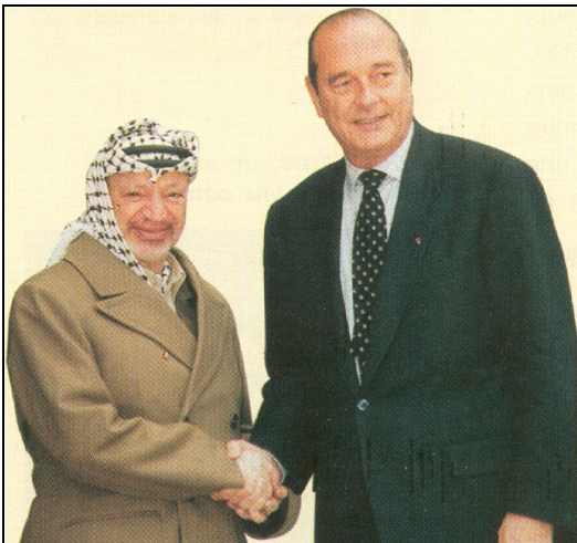
Doc.4 : Le président Jacques Chirac reçoit le chef de l'OLP Yasser Arafat à l'Élysée, en 1998.

Doc.5 : Une intervention militaire française au Rwanda en 1994