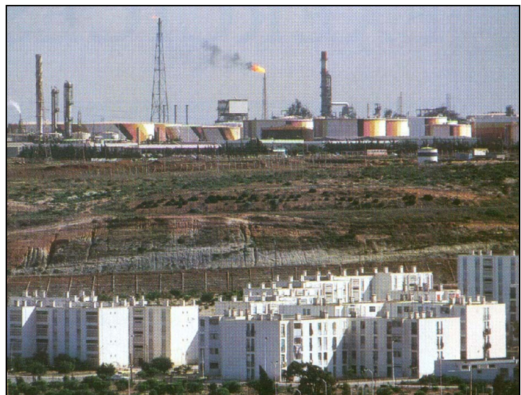
Doc.3 : La raffinerie de pétrole d'Arzew