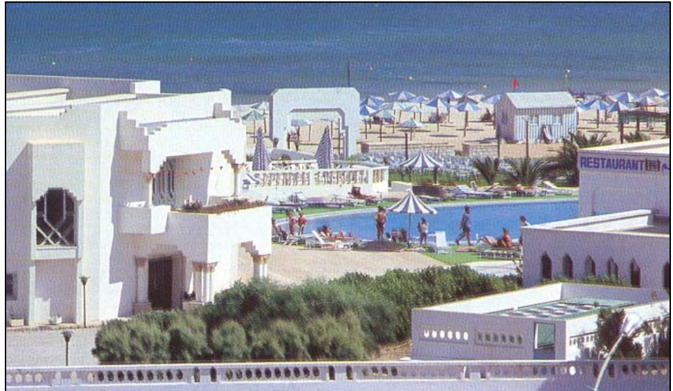
Doc.1 : Hammamet (Tunisie), première station touristique du monde arabe et de l'Afrique

D'après G.Mutin, Afrique du Nord, Moyen-Orient , G.U., 1995.